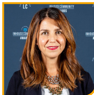
Figura stimata del panorama bancario italiano, dal 2017 dirige il dipartimento legale e affari regolamentari di Banco Bpm. Assiste il gruppo in operazioni significative e delicate, come la fusione che ha dato vita all'attuale Banco Bpm o le più recenti ops su Anima e ops da parte di Unicredit.